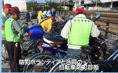
防犯ボランティアと合同の自転車防犯診断

全ての県民が安全で安心して暮らせる地域社会の実現に向けて、防犯ボランティアの方々と連携しながら、防犯診断や防犯パトロール、街頭広報キャンペーン等を行っています。