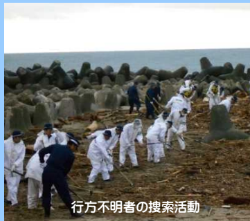
行方不明者の捜索活動

避難指示区域、台風被害の被災地等の安全・安心を確保するため、昼夜を問わず警戒活動を実施しています。また、東日本大震災で行方不明になっている方の捜索活動も継続して実施しています。