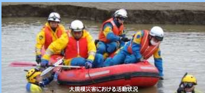
大規模災害における活動状況

大規模災害等に備えて実戦的な訓練を積み重ね、部隊員の災害対処能力の向上や、部隊間・関係機関との連携強化を図っています。