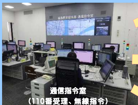
通信指令室 (110番受理、無線指令)