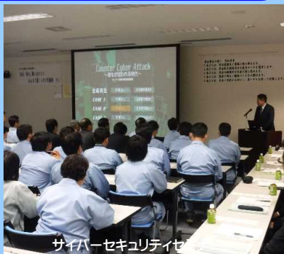
サイバーセキュリティ

サイバー攻撃による被害の未然防止や被害拡大防止のため、重要インフラ事業者等へのセキュリティに関する情報提供や事案発生を想定した共同訓練等を実施しています。