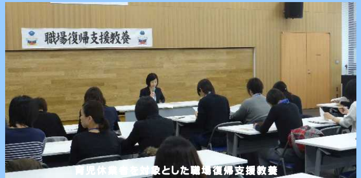
育児休業者を対象とした職場復帰支援教室

職員のワークライフバランス（仕事と私生活の両立）に向けて、業務の効率化・高度化、計画的な休暇の取得促進、育児や介護等の事情を抱える職員に対する組織的な支援等の様々な取組を推進して、働きやすい職場環境づくりに努めています。