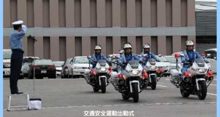
交通安全運動出動式

悲惨な交通事故から県民を守るため、関係機関・団体や交通ボランティアと連携しながら、各季の交通安全運動等で街頭活動を行うなど、地域と一体となった交通安全活動を推進しています。