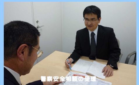
警察安全相談の受理

犯罪等による被害の未然防止のための相談その他、誰もが事件・事故のない平穏な生活を送ることができるよう相談窓口を設けています。