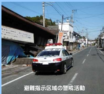
避難指示区域の警戒活動