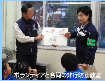
ボランティアと合同の非行防止教室

少年が非行を起こさないための非行防止教室やインターネットを利用して犯罪に巻き込まれないための情報モラル教室を開催しています。また、少年の福祉を害する事件等の取締りや、大きな社会問題になっている児童虐待事案への対応を行っています。