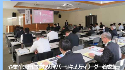
企業・官公庁に対するサイバーセキュリティリーダー養成講座

誰もが安心してインターネットを利用できる環境づくりのため、官民連携による広報活動を推進するとともに、不正アクセス等の悪質かつ高度なサイバー犯罪の取締りを強化しています。