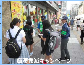
痴漢撲滅キャンペーン

ストーカーやDV、子供・高齢者の虐待や行方不明事案等、被害者や家族の意向に配慮しながら、被害者等の安全確保を最優先とした対応に努めています。また、子供や女性を犯罪被害から守るため、関係機関・団体と連携した被害防止活動に取り組んでいます。