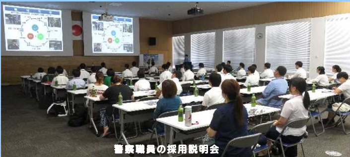
警察職員の採用説明会

若手警察官による出身校への募集活動、他官庁等との合同採用説明会や体験型の採用説明会の開催、県警察ホームページやツイッター等のSNSを活用した広報を通じて、多くの方に警察業務の魅力伝えることにより、将来の福島県警察を担う人材の確保に取り組んでいます。