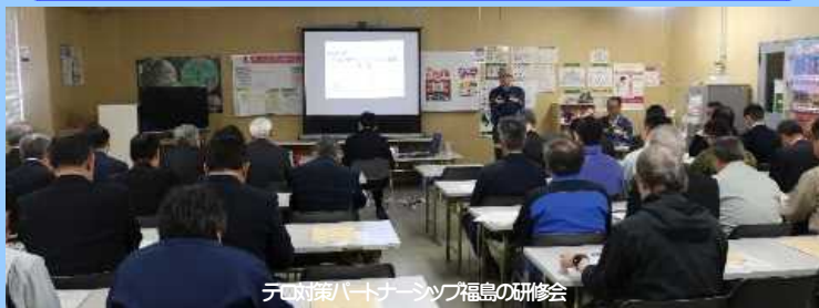
テロ対策パートナーシップ福島の研修会

原子力発電所等の重要施設や鉄道等公共交通機関の警戒警備を強化し、関係機関・団体と連携した各種テロ対応訓練を実施しています。また、爆発物原料販売事業者、旅館、レンタカー事業者及びインターネットカフェ等と連携した官民一体のテロ対策を推進しています。