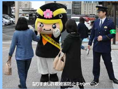
なりすまし詐欺被害防止キャンペーン

なりすまし詐欺の被害を防ぐため、関係機関・団体等と連携しながら、街頭キャンペーンや防犯講話等の広報啓発活動を行っています。