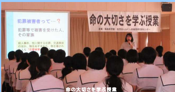
命の大切さを学ぶ授業

社会全体で事件・事故の被害者等を支える気運を醸成するため、中学校・高校等において、被害者等を講師に「命の大切さを学ぶ授業」、各地域で行われる会合・教室等の機会に、警察職員が被害者等の手記朗読などを通し心情を伝える「被害者に優しい地域づくりミニ講座」を行っています。