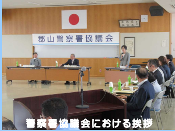
警察署協議会における挨拶

県公安委員会は、定例会議の場等で警察本部長等から、事件、事故、災害等の発生状況とそれを踏まえた警察の取組、組織の運営状況等について報告を受け、これを指導することにより県警察を管理するとともに、運転免許、交通規制や古物営業等の監督等の事務を処理しています。また、警察署協議会への参加、警察活動の現場視察等により、治安情勢と警察運営の把握に努めています。