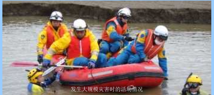
发生大规模灾害时的活动情况

为了防备大规模灾害等，我们反复地进行实际训练，提高队员的应对灾害能力，还加强队与队之间以及与相关机关的合作。