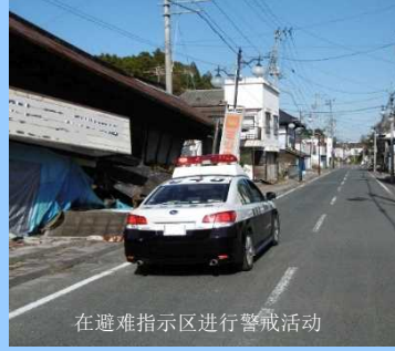
在避难指示区进行警戒活动