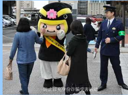
防止冒充身份诈骗受害活动

为了防止冒充身份诈骗的受害，一边和相关机关团体合作，一边进行街头活动和防范讲座等宣传启发活动。