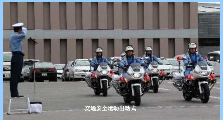
交通安全运动出动式

为了保护县民避免遭遇悲惨的交通事故，与相关机关·团体及交通志愿者等合作，开展各个季度的交通安全活动等的街头活动，与当地居民齐心协力推进交通安全活动。