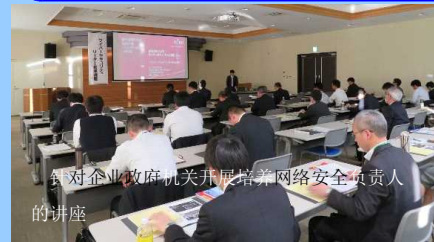
针对企业政府机关开展培养网络安全负责人的讲座

为了创造使全体县民安全使用网络的环境，我们政府和民间共同推进宣传活动，还加强取缔非法访问等既恶劣又高度的网络犯罪。