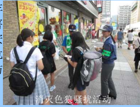
消灭色狼骚扰活动

对于跟踪狂、家庭内暴力、儿童・老年人虐待以及失踪等案件，我们会尊重受害人与其家人意愿，优先采取保护受害人安全的措施。为了使儿童和女性避免犯罪危害，与相关机关，团体合作，开展各种防止犯罪危害活动。