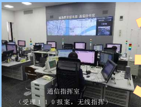
通信指挥室 (受理110报案，无线指挥)