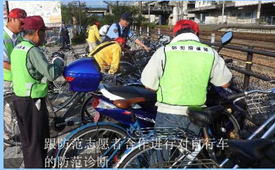
跟防范志愿者合作进行对自行车的防范诊断

为了构建所有县民安全安心生活的地区社会，和防范志愿者们合作，进行防范诊断、防范巡逻、街头宣传等活动。