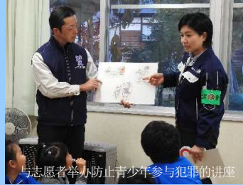
与志愿者举办防止青少年参与犯罪的讲座