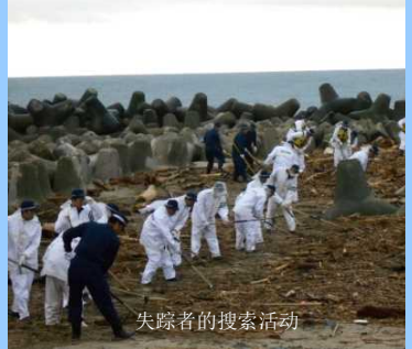
失踪者的搜索活动

为了确保避难指示区域和台风的受灾地区等的安全·安心，在全国警察的支援下，我们不分昼夜地进行警戒活动。