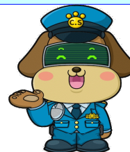
福島県警サイバー 防犯キャラクター ダメポチくん

福島県警察本部生活安全部生活環境課 サイバー犯罪対策室 情報提供メール： fp-hitec@police.pref.fukushima.jp