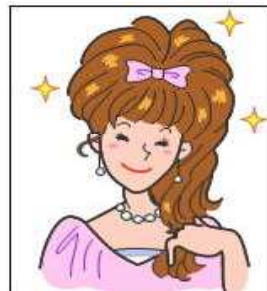
輪郭や肌をデジタル処理 正面を向いていない