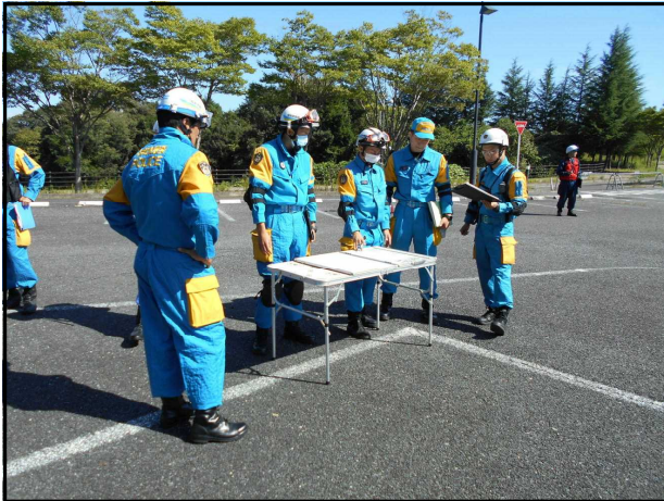
現地指揮所設置訓練

大規模災害の発生に備え、広域緊急援助隊、緊急災害警備隊、機動警察通信隊等が訓練に参加し、幹部の指揮能力及び部隊の知識・技術の向上並びに各部隊相互の連携強化を図りました。