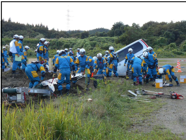
土砂埋没車両からの救出・救助訓練