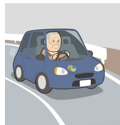
高齢者の交通事故防止