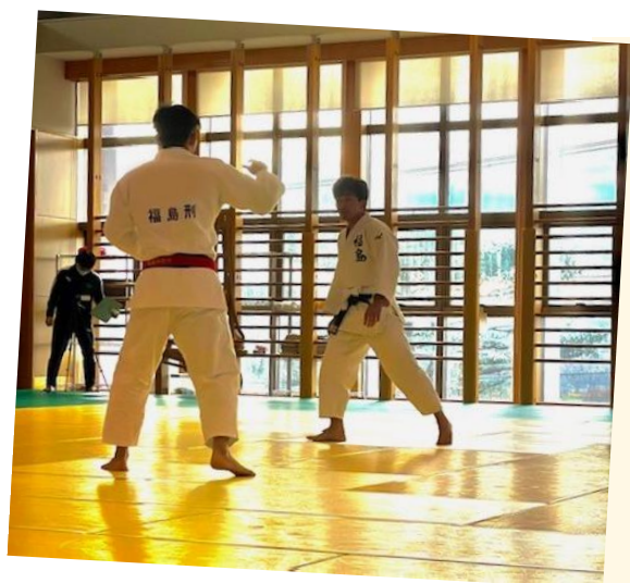
↑ 柔道の大会に出場！

福島県警察の代表として柔道の稽古に励み、各種大会に出場することや、各所属の警察官に対して術科教養をすることが主な仕事内容です。子どもの頃から続けてきた柔道を活かし、警察官の現場執行力強化に貢献できることにやりがいを感じます。