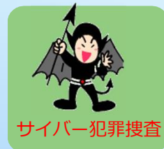
サイバー犯罪捜査