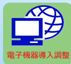
電子機器導入調整